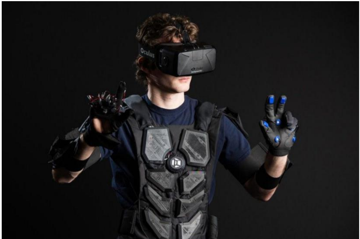
Рис. 4. Костюм виртуальной реальности, позволяющий отслеживать движения пользователя [6]

Санкт-Петербургский университет ГПС МЧС России также не отстает от современных тенденций совершенствования образовательного процесса – в частности, в рамках сотрудничества со специалистами из Финляндии разрабатывается международный научный проект, направленный, в том числе, на разработку виртуальной реальности для проведения совместных учений специалистов из России и Финляндии.