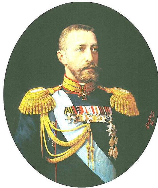
Великий князь Константин Константинович Романов В детские годы В зрелом возрасте