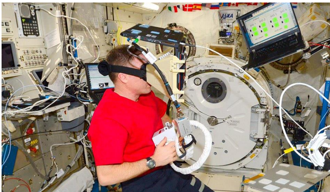
Рис. 1. Использование очков виртуальной реальности для тренировок космонавтов на борту МКС (URL: https://habr.com/ru/post/376715/ , дата обращения: 23.04.2021)