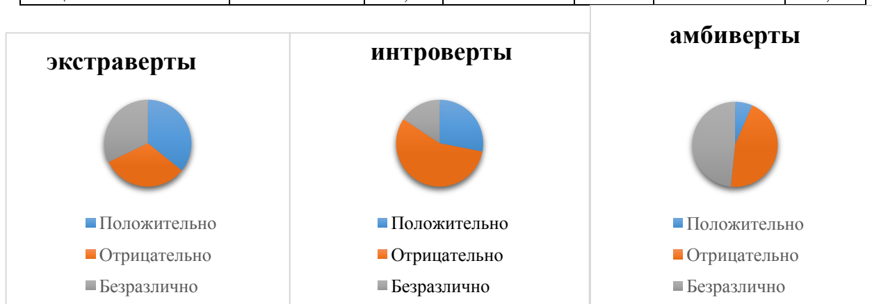
Рис. Результаты ответов подростков на вопрос об их отношении к обязательному характеру вакцинации

Анализируя полученные данные, следует отметить, что 45 % анкетированных выразили резко отрицательное отношение к обязательности вакцинации. При этом 35,9 % подростков проявили своё безразличное отношение, а 19,1 % выступили в поддержку обязательной вакцинации. Наибольшее число тех, кто не сформировал свою позицию составили амбиверты (48,4 %). Кроме того, из их числа также минимальное количество относящихся к обязательной вакцинации положительно. Наибольшая доля отрицательно относящихся к общеобязательному характеру вакцинации была выявлена из числа интровертов (табл. 3).