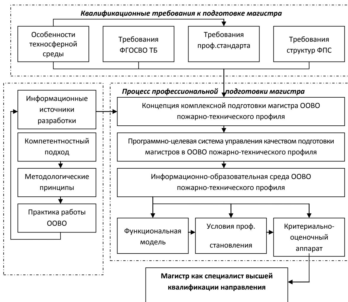
Рис. 1. Концепция профессиональной подготовки магистра

Специфика функционирования магистратуры в ООВО пожарно-технического профиля предполагает необходимую вариативность, обусловленную пониманием обучающимися сферы своей последующей служебной деятельности, что требует максимально возможный уровень индивидуализации учебного процесса. Необходимая и достаточная вариативность в подготовке магистров требует использования разнообразных педагогических технологий, например, в виде формирования индивидуальных образовательных траекторий, содержание которых в рамках существующих образовательных программ соответствует потребностям комплектующих подразделений ФПС [3]. Это может способствовать необходимой практикоориентированности процесса профессиональной подготовки магистров как специалистов высшей квалификации по избранному направлению, что требует включенности обучающихся в реальную профессиональную среду [4].