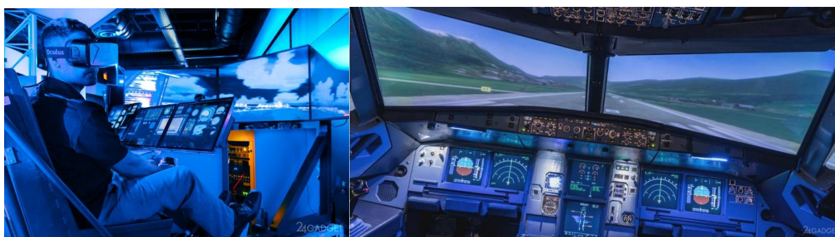
Рис. 2. Использование технологий виртуальной реальности в подготовке летного состава (URL: https://24gadget.ru/1161068212-armeyskih-letchikov-otpravyat-v-virtualnuyu-realnost.html , дата обращения: 23.04.2021)

Технология виртуальной реальности с успехом завоевывает и медицинскую отрасль – интерактивные модели органов позволяют успешно имитировать процесс хирургического вмешательства, а анализ врачом трехмерных моделей систем организма пациента (томография, УЗИ и т.д.) существенно повышает качество диагностики и последующего наблюдения пациентов. Технологии виртуальной реальности, позволяющие моделировать движения скальпеля или другого медицинского инструмента с помощью виртуальной перчатки, способствуют значительному повышению уровня подготовки студента-врача, снижению количества врачебных ошибок в профессиональной деятельности [4].