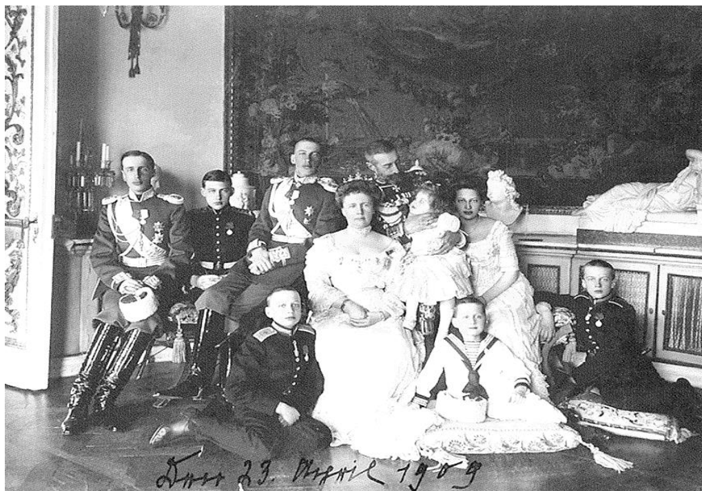
Великий Князь К.К. Романов с семьей

Великий князь оказал большую помощь и Августейшее покровительство полярной экспедиции барона Э.В. Толля, которая была организована академией наук [1–3].