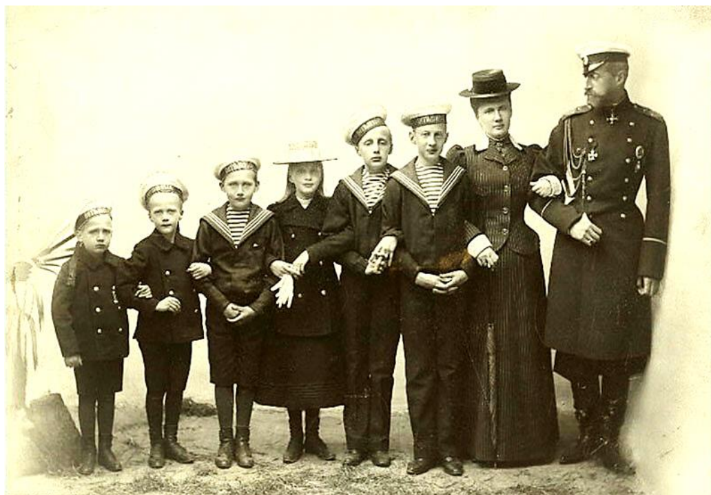
Великий князь Константин Константинович с женой принцессой Елизаветой Августой Марией Агнессой и детьми

Константин Константинович был женат на принцессе Елизавете Августе Марии Агнессе (русское имя – Елизавета Маврикиевна). У них родилось девять детей.