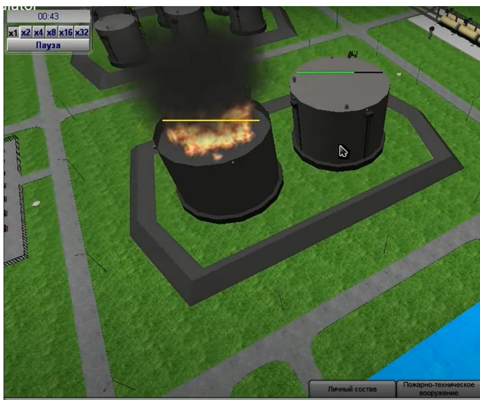
Рис. 3. Имитация пожара в резервуарном парке с помощью программных технологий

Другой модуль программы воссоздает условия чрезвычайной ситуации (ЧС) – например, пожара в резервуарном парке (рис. 3). Обучающийся выступает в роли руководителя тушения пожара – выбирает необходимую технику для тушения, привлекает требуемое количество сил и средств. При этом программа воссоздает процесс развития пожара – по истечении контрольного времени или при неправильных действиях по тушению резервуар начинает разрушаться. При имитации тушения пожара в здании учитывается не только время горения, но и предел огнестойкости строительных конструкций.